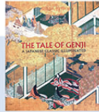
NYメトロポリタン美術館 「The Tale of Genji (源氏物語展)」(2019)